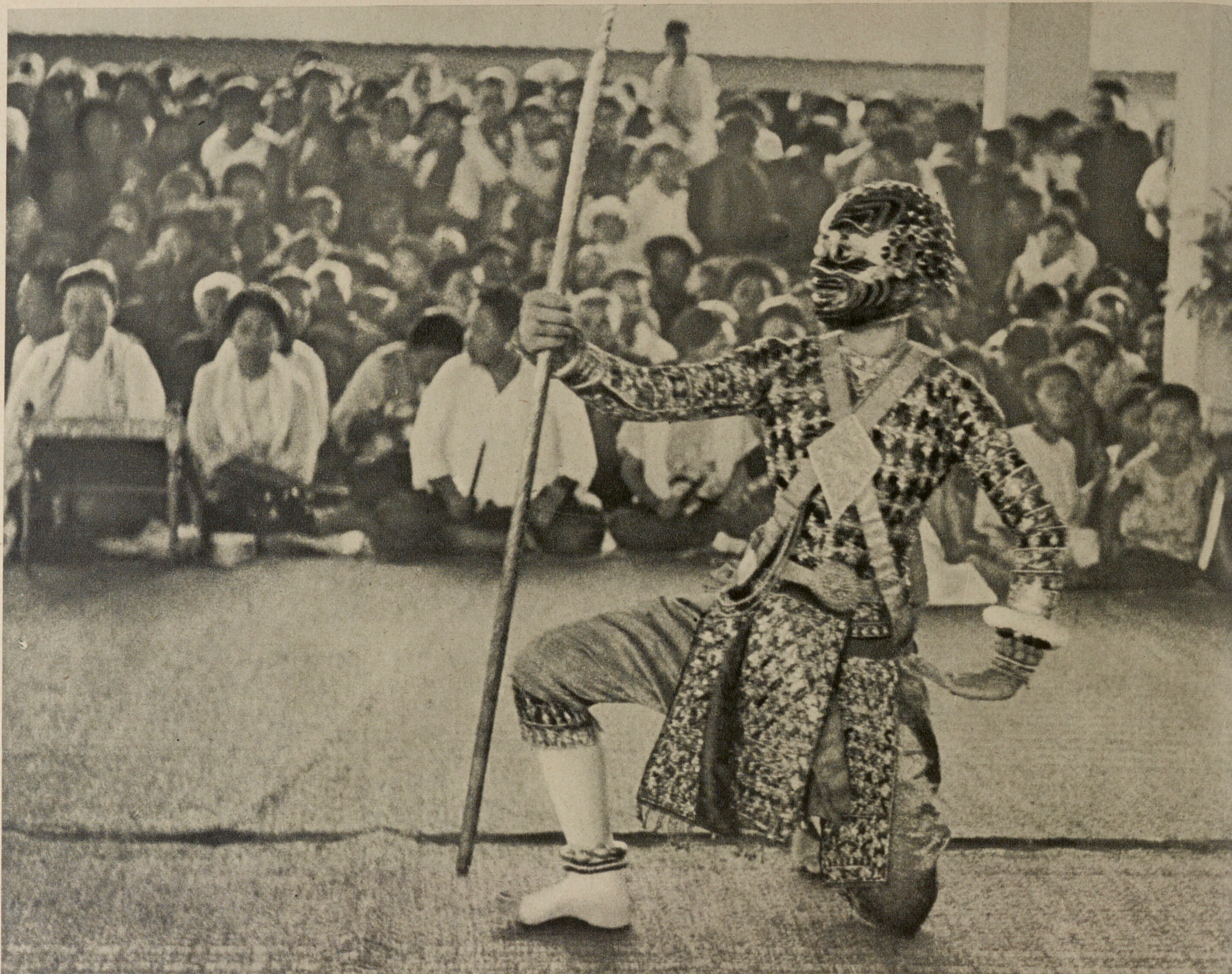
DANSE DE NGOH. AU FOND, LA RÉCITANTE DEVANT SON PUPITRE DORÉ ET LES CHORISTES AVEC LEURS BAGUETTES A SCANDER LA MESURE.

puissance des géants, sommeil des princes, maniement de l'arc, capture du cheval, air de voguer sur l'eau... et tous les airs de transition pour les déplacements, dont celui, au rythme plus précipité, qui annonce la fin de la danse.