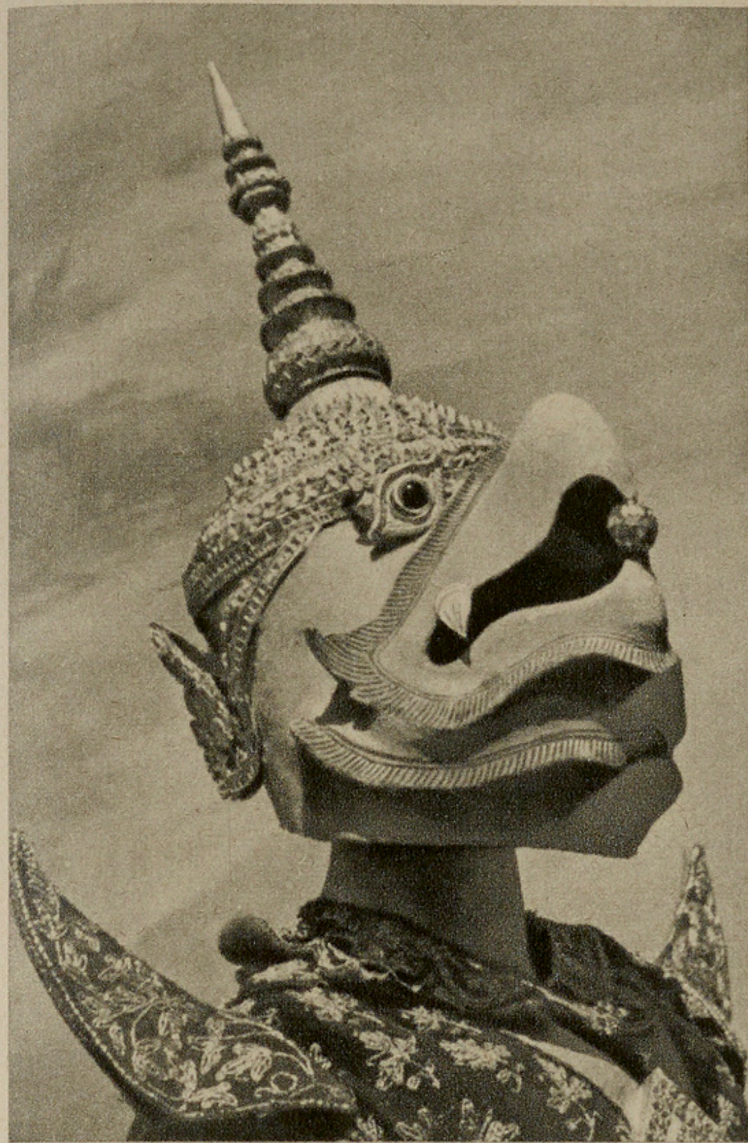
MASQUE DE GARUDA, LE ROI DES OISEAUX.