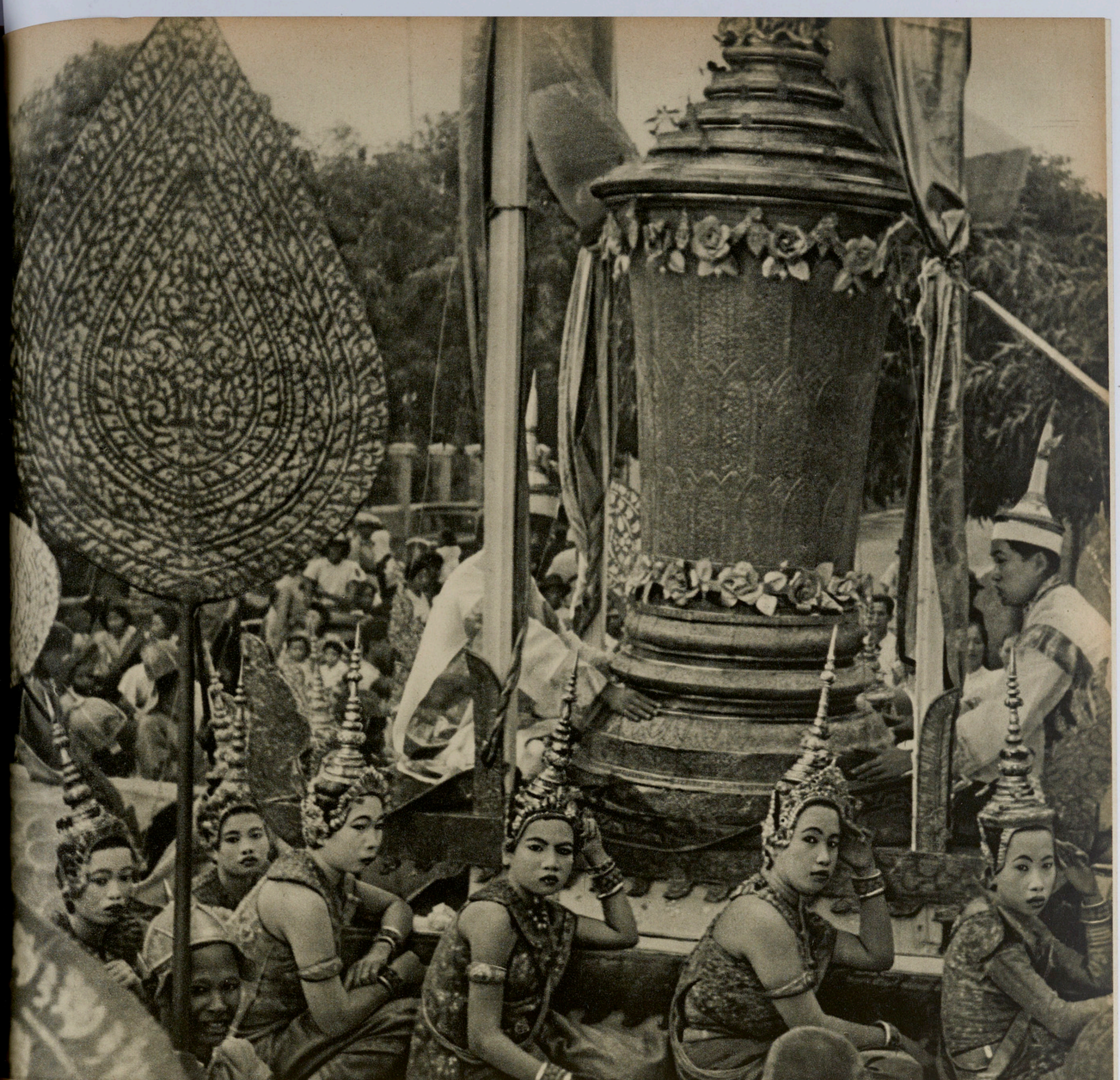
DANSEUSES ROYALES AUTOUR DE L'URNE FUNÉRAIRE.

Assises à terre, les jambes repliées sur un côté, le buste droit, les danseuses