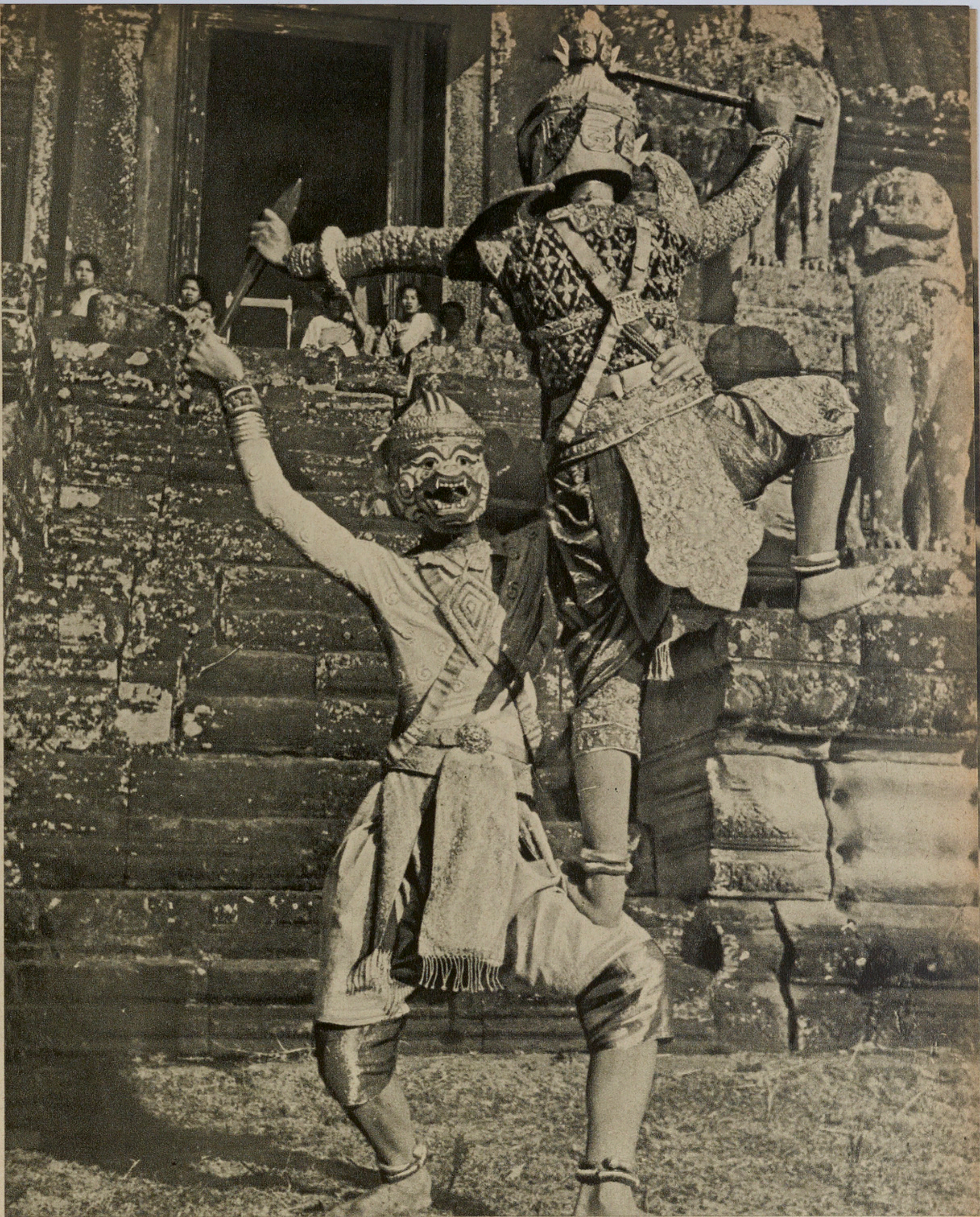
COMBAT DU ROI DES YAKS ET DU SINGE BLANC.