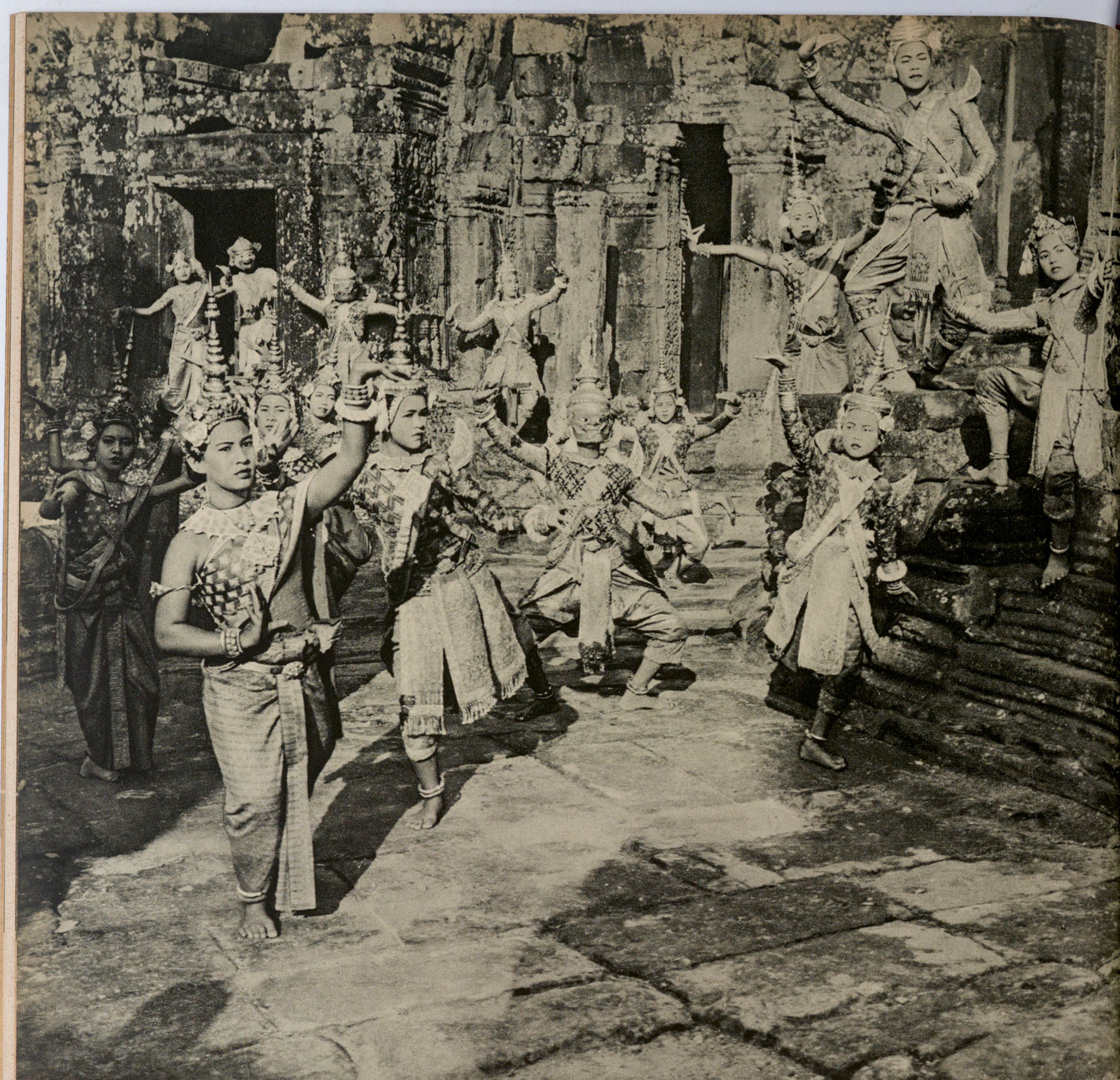
DANSEUSES ROYALES DANS LES RUINES DU BAYON.

chaque matin se rendent au Conservatoire royal. Comme autrefois elles débutent par la demi-heure d'exercices d'assouplissement, puis elles répètent ; le soir, elles vont à l'école apprendre à lire et à écrire. De plus, un cadre d'enseignement technique a été créé où l'on forme des maîtresses spécialisées.