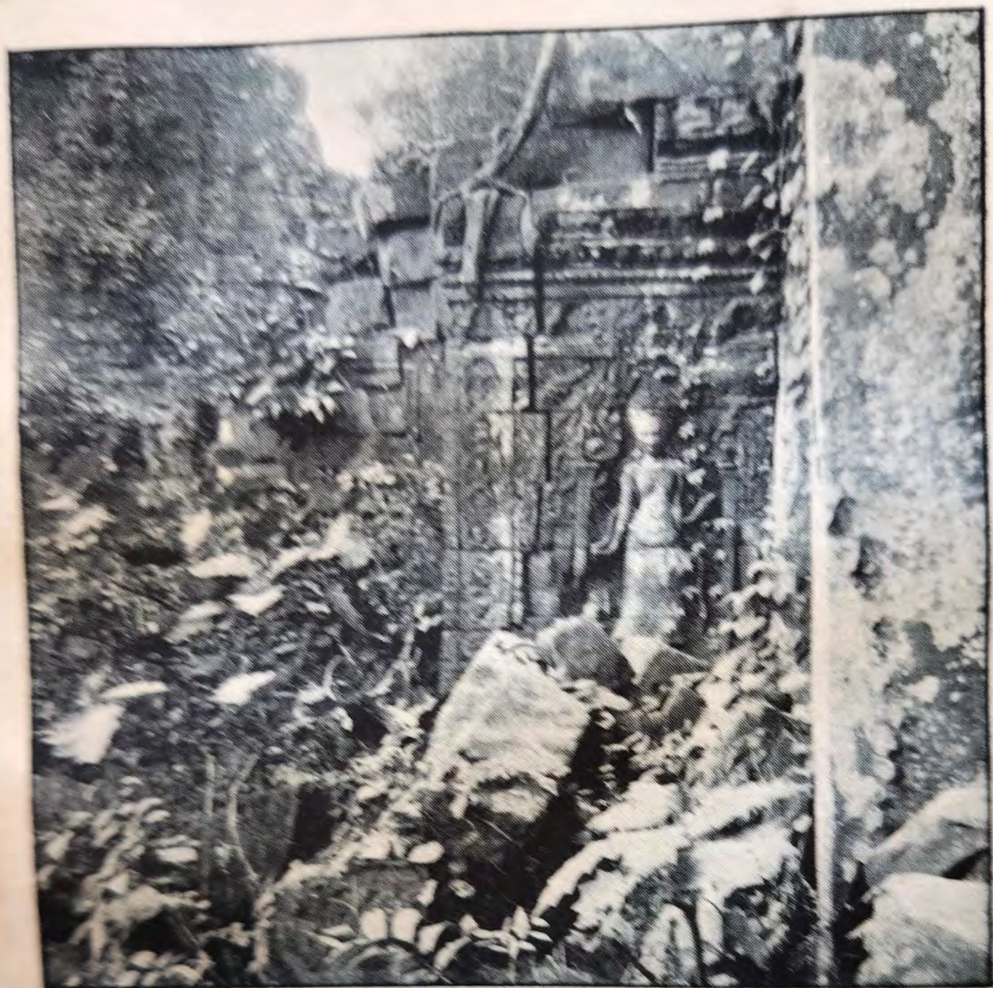
UN TEMPLE PERDU DANS LA JUNGLE