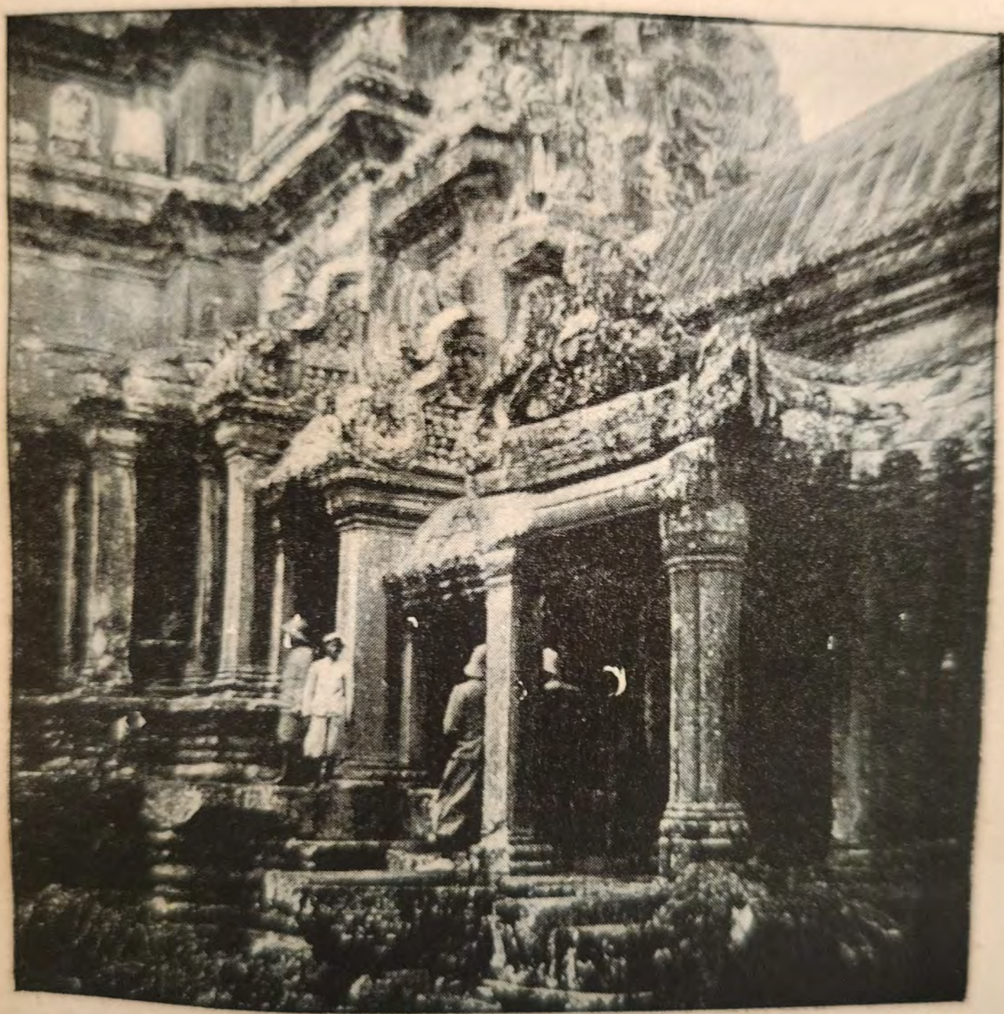
DANS LA COUR INTÉRIEURE D'ANGKOR WATT