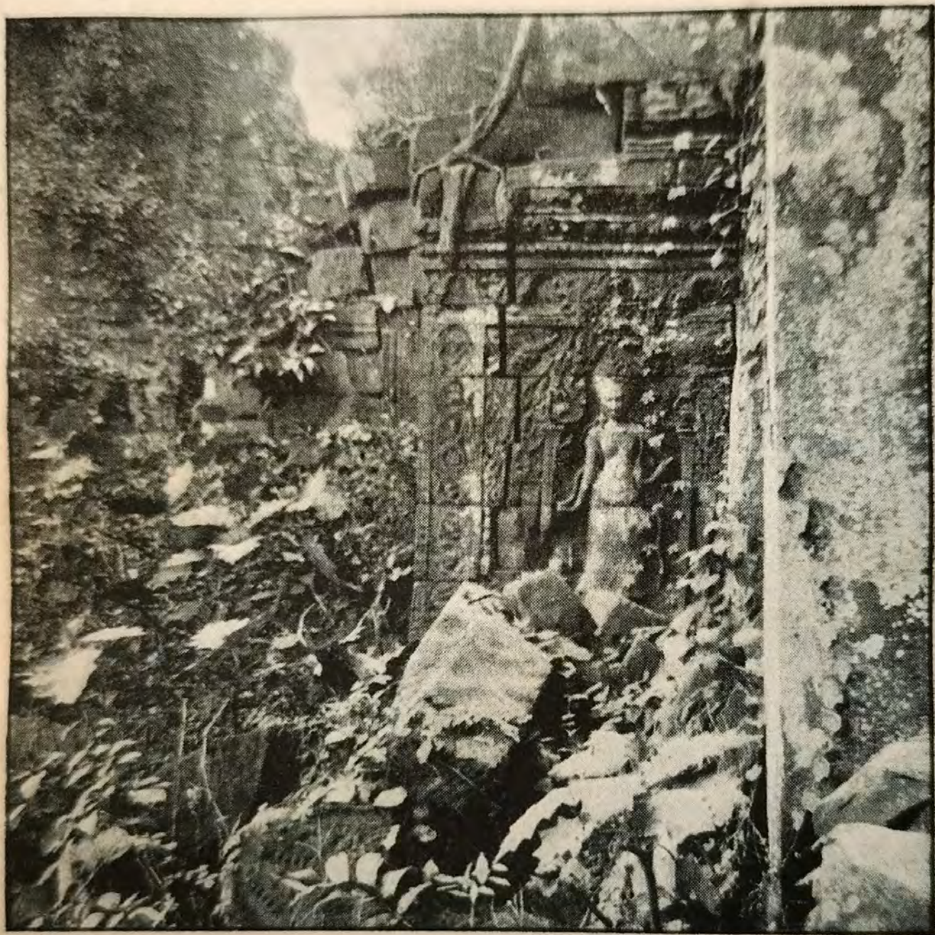
UN TEMPLE PERDU DANS LA JUNGLE