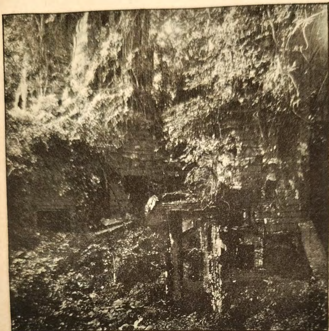
LE BAYON, ENVAHI PAR LA FORÊT avant les réparations effectuées depuis 1907, par l'Administration Française.