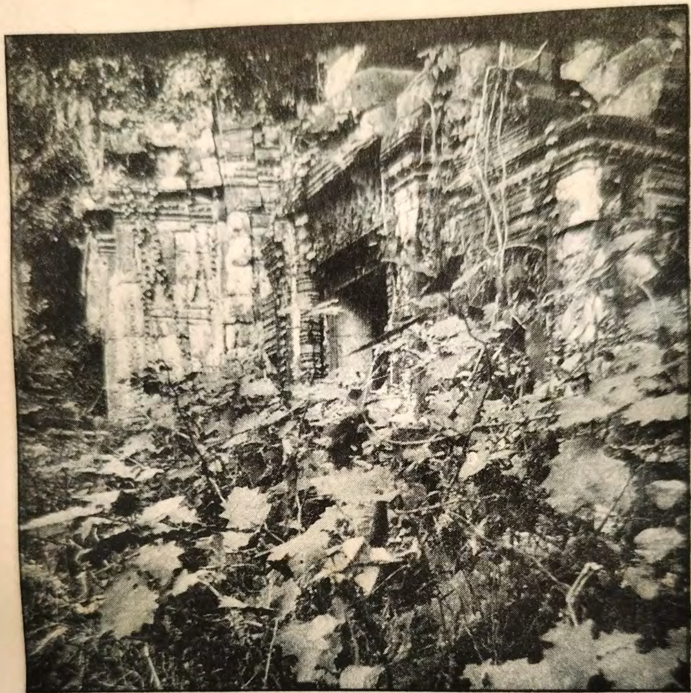
LES PLANTES ET LES LIANES A L'ASSAUT D'UN MONUMENT