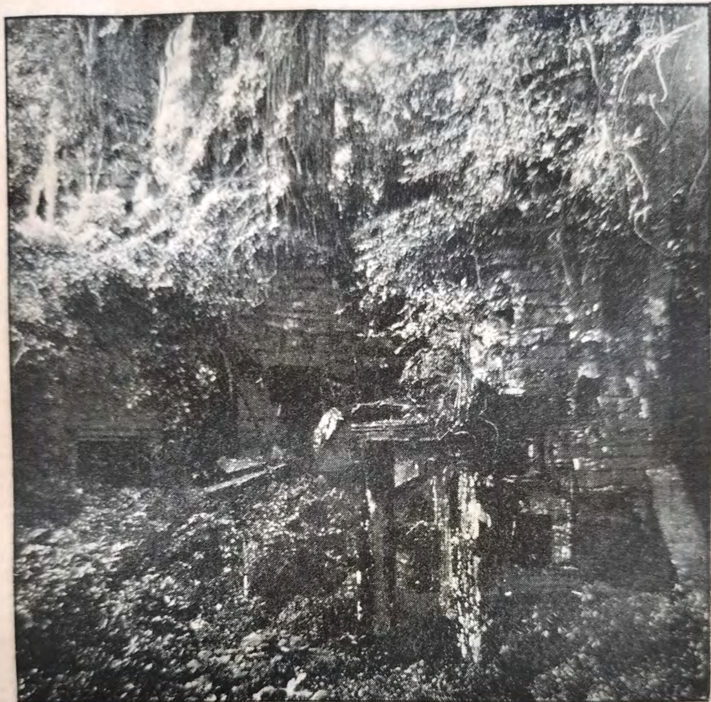
LE BAYON, ENVAHI PAR LA FORÊT avant les réparations effectuées depuis 1907, par l'Administration Française.