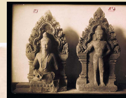
PIÈCES À CONVICTION N° 1 ET 2. Ces bas-reliefs ne figurent pas sur le plan. Au moment de leur découverte, George Groslier n'est pas sûr qu'ils proviennent bien du groupe de Banteay Srei, qui comporte plusieurs édifices.