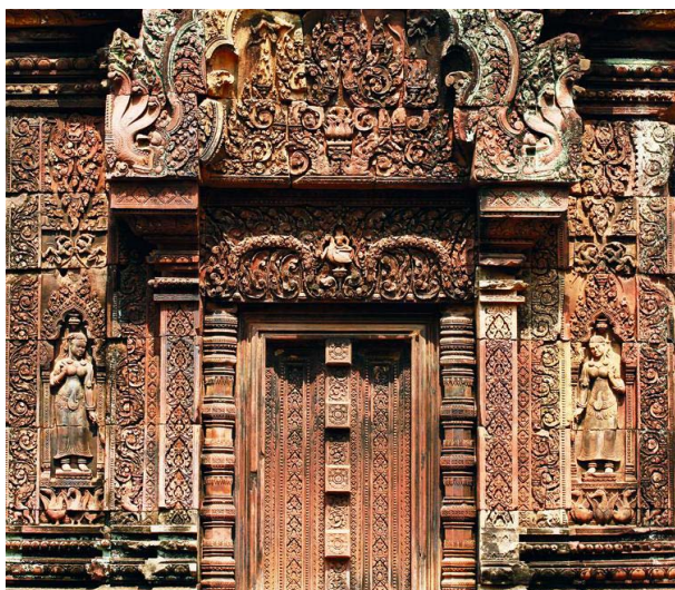
LE TEMPLE DE BANTEAY SREI, en mai 2018, avec les statues volées par Malraux remises en place (nos 5 et 6A, p. 61).