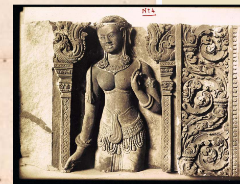
PIÈCE À CONVICTION N° 4.