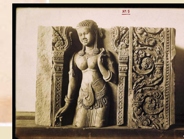
PIÈCE À CONVICTION N° 5.

FR ANOM. AIX-EN-PROVENCE FRANOM. 3F1_1390