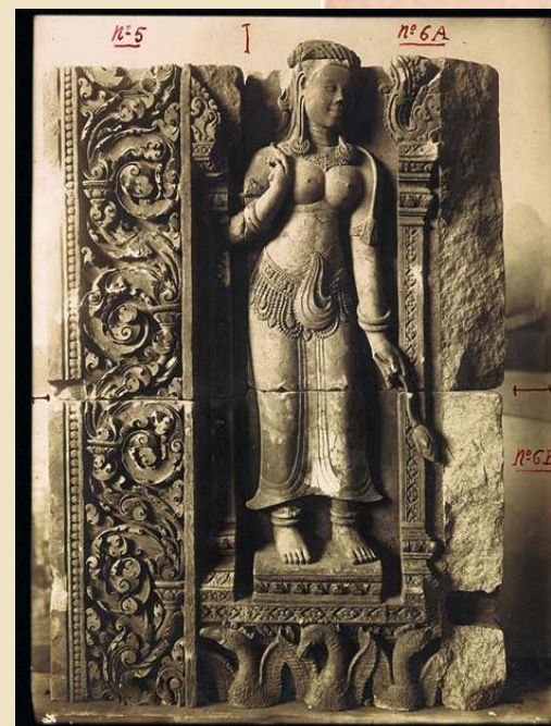
PIÈCES À CONVICTION N° 6A.